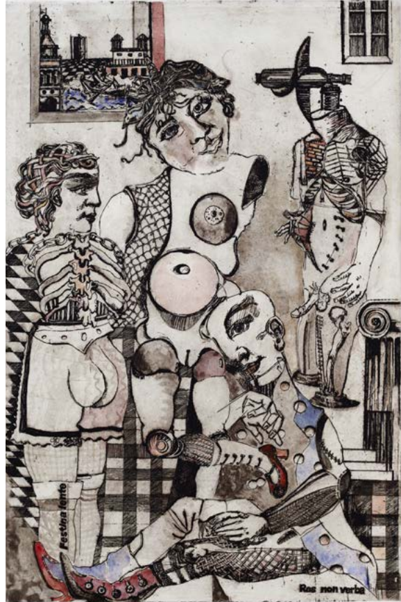
Mon intérieur, 72x54cm, eau forte, aquatinte et rehaut d'aquarelle, 2014