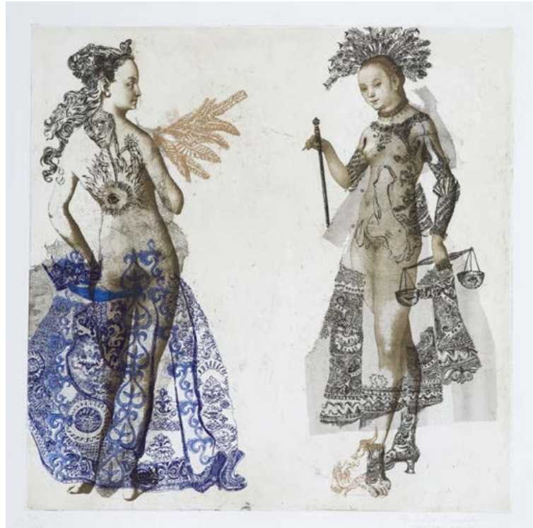
Ladies, 72 x 72 cm, 2016