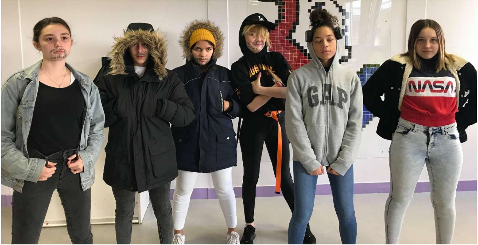
Les élèves filles travesties en leurs camarades masculins, attitudes et postures, photo issue d'une action culturelle menée avec une classe de 3 e du Collège des Hyverneaux de la ville de LESIGNY (77).