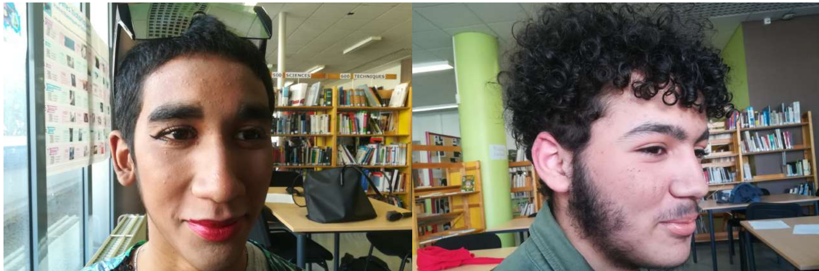
Deux garçons de quinze et seize ans s'apprêtant à jouer un personnage féminin, lycée d'Argenteuil, classe de seconde, mars 2020.