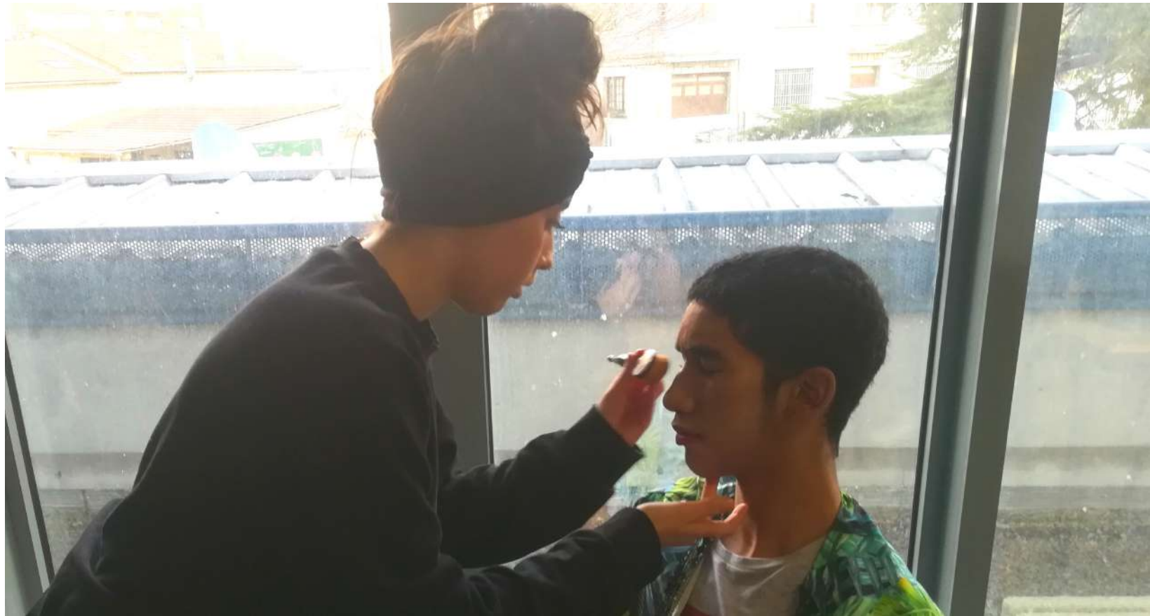
Les filles maquillent les garçons qui vont jouer Juliette et les aident à se "costumer," lycée d'Argenteuil, classe de seconde, mars 2020.