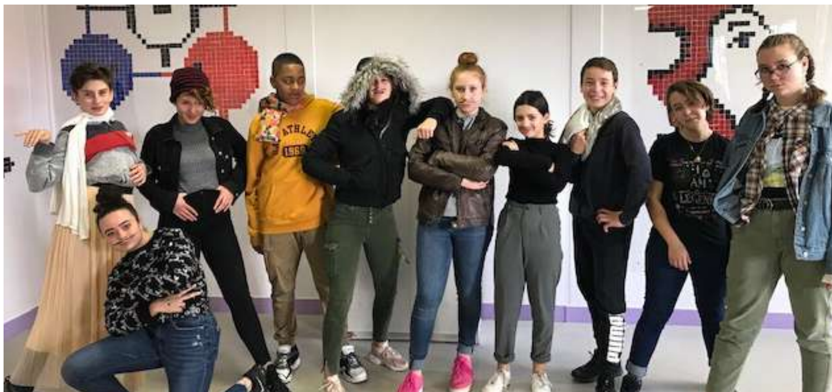
Photo issue d'une action culturelle menée avec une classe de quatrième du Collège des Hyverneaux de la ville de LESIGNY (77)

Autour des thématiques soulevées par le spectacle, divers types d'interventions sont possibles selon le temps accordé par l'établissement. Un premier échange encadré entre les actrices et les élèves introduit le parcours artistique et pédagogique. Nous leur proposons des pistes de réflexion adaptées à leurs niveaux, à leurs intérêts et à l'ambiance de la classe. Enfin, nous passons aux ateliers pratiques, au jeu théâtral ayant pour fond les sujets abordés précédemment.