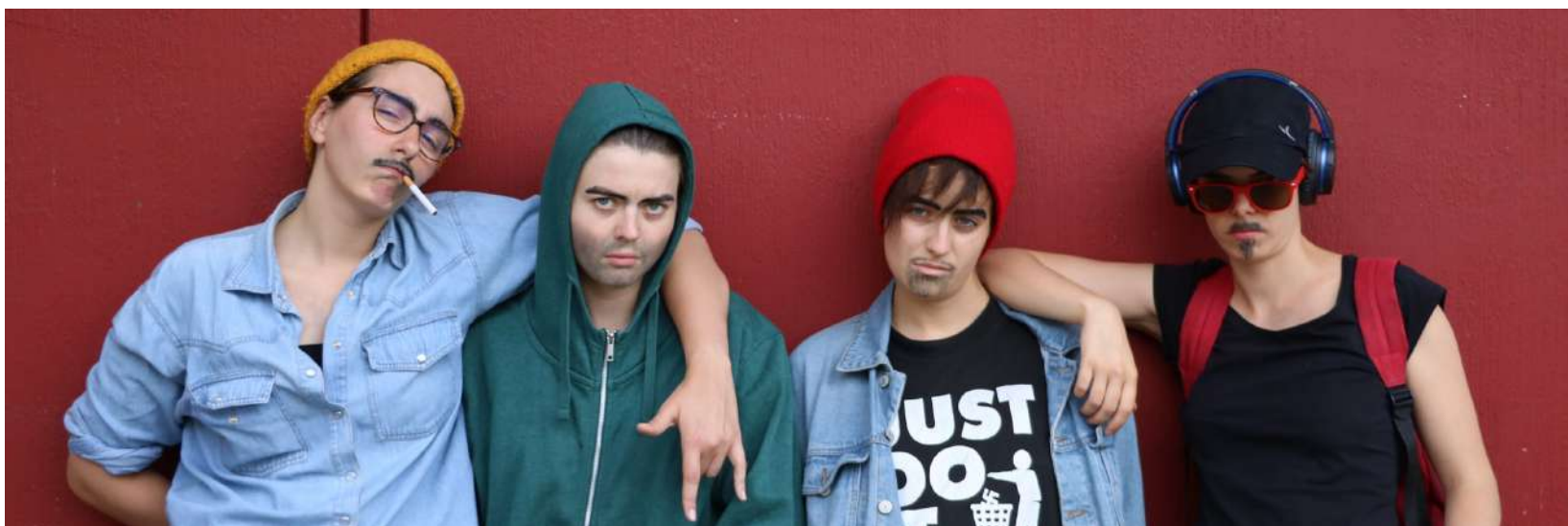
Les comédiennes de la compagnie OKTO travesties lors d'une résidence de création au Théâtre Paul Eluard de Choisy-le-roi, Scène conventionnée d'intérêt national, 2018.