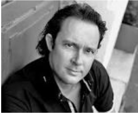
Christophe BERRY, ténor