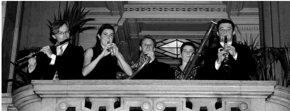
le concert impromptu, en octobre 2005, à l' Odeon Theaterverein de Vienne