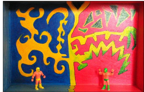
Caja de lucha

Peintre autodidacte, il débute la peinture lors de son arrivée en France..