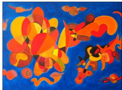
Tejido de Cempasúchil

Il réalise en 2007 ses trois premières expositions, dans la région bordelaise et le Loir-et-Cher.