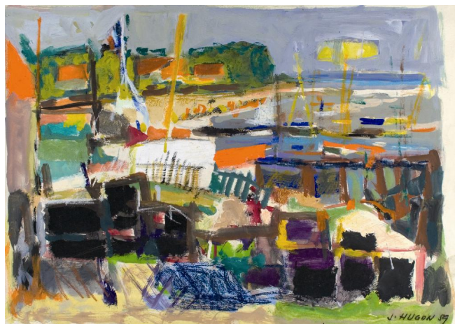
Le Cap-Ferret (Gironde) gouache, 50 x 65 cm, 1959.

Jean Hugon est un peintre solaire, un coloriste incroyable ; l'hommage qui lui est rendu à travers cette exposition est un éblouissement coloré tout en nuances et en sensibilité.