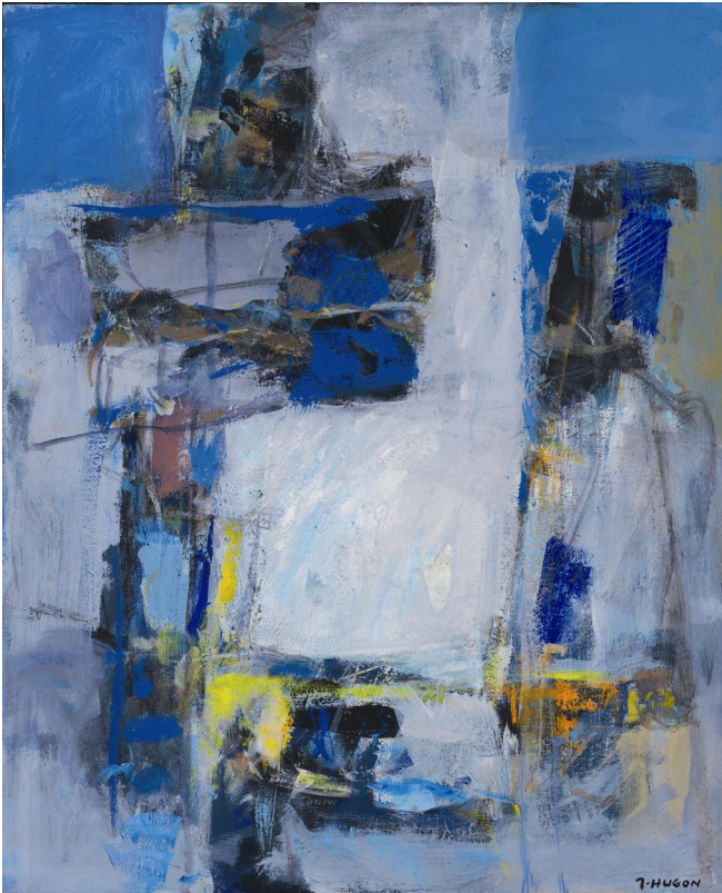
Peníscola , acrylique sur toile, 73 x 60, 1988.