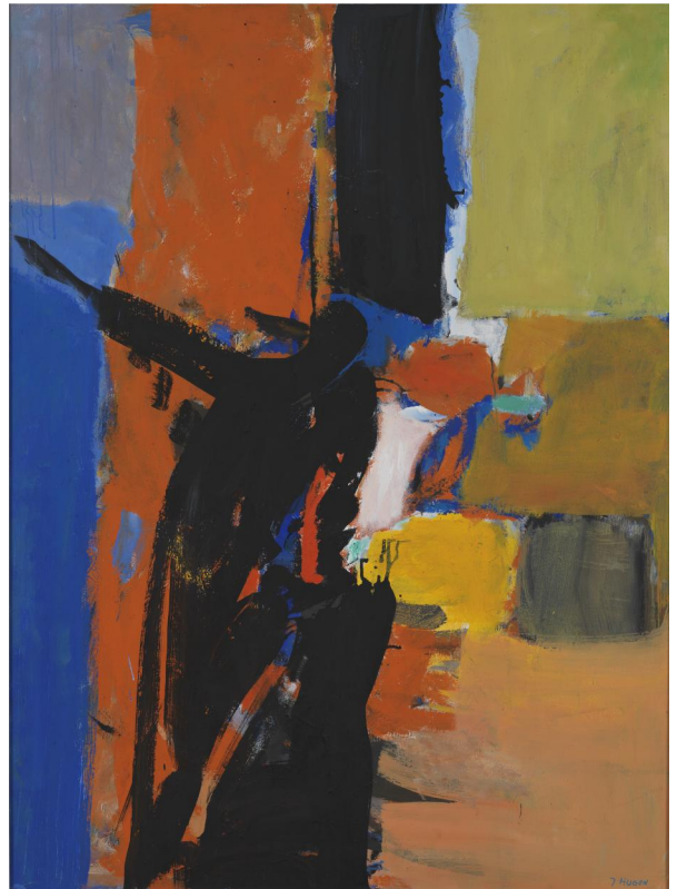
Silhouette noire , acrylique sur toile, 1989.

[...] Bleus, blancs, ors, mauves profonds, rouges feu, verts intenses, lumières immenses. Lumières, c'est dans la lumière que Jean Hugon, coloriste autodidacte, conduit son œuvre jusqu'à l'épanouissement de ses ultimes toiles. [...] [...] Lumières de Marseille, sa ville natale, qui le guident des rives de la Méditerranée à celles de l'Atlantique dont il saura exploiter les nuances infinies. Lumières dont il guette tous les effets de ses premières ébauches, gauches et massives aux fulgurances de ses acryliques de la plénitude. Lumières vérités qui conduisent sa vie d'homme simple, solitaire, généreux, puissant et passionné. [...] [...] L'audace des compositions nées de sentiments exacerbés est étonnante d'invention, de jeunesse, de tumultueuse impétuosité comme s'il avait la sensation de n'avoir pas le temps de nous proposer toutes les perspectives de son immense talent. [...]