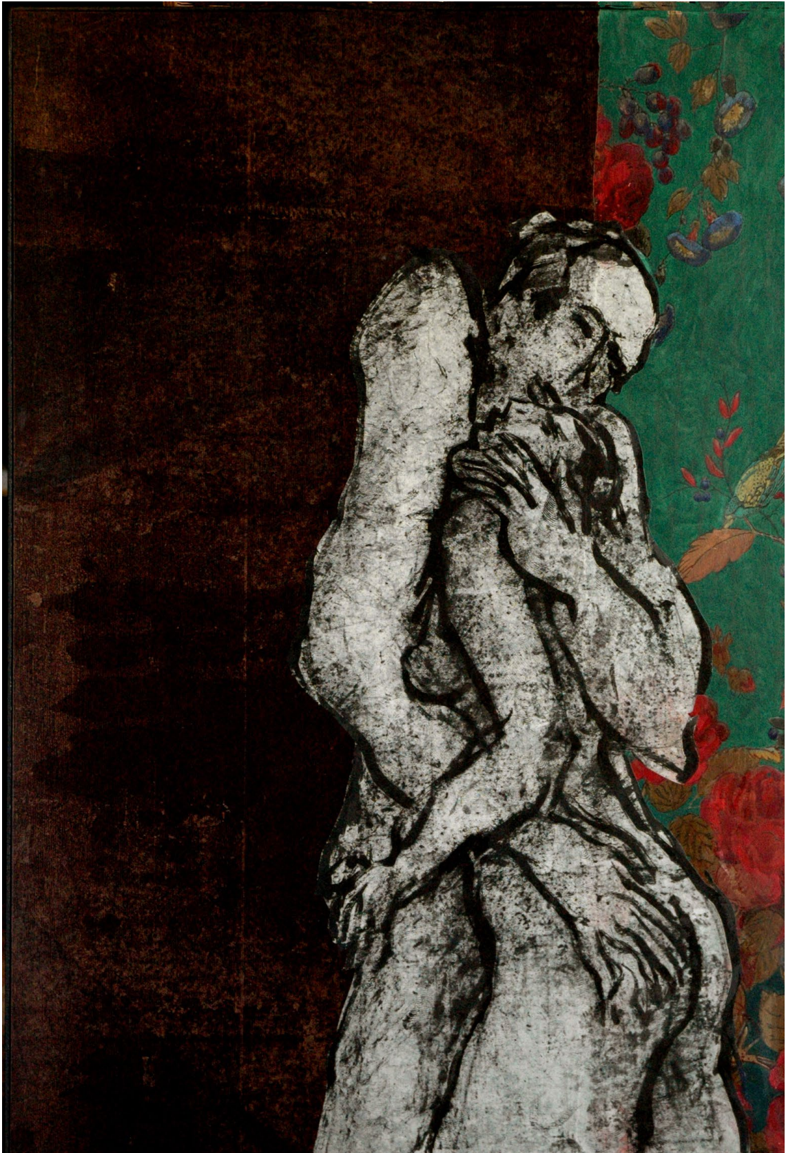
ALAIN BERGEON | QUELQUES AUTO-PORTRAITS... Exposition salle George Sand // Langon // Du 12 janvier au 2 mars 2024